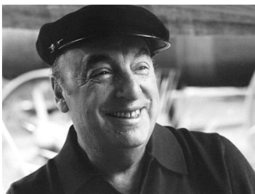
Pablo Neruda (Chile 1904-1973)